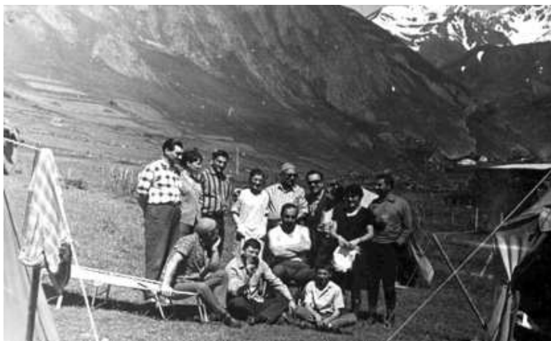
1968 წლის ჩრდილოეთ ოსეთის ეთნოგრაფიული ექსპედიცია, სოფელი ზარამაგი