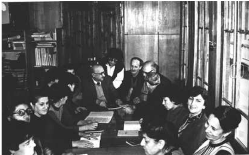
თბილისი, 1987 წელი, ღია ცის ქვეშ მუზეუმი