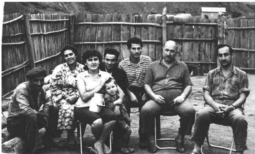
1962 წლის ინგუშეთის ეთნოგრაფიული ექსპედიცია, სოფელი ოღგეთი