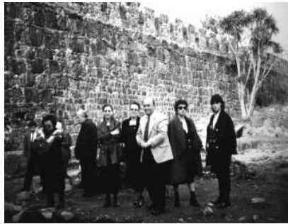
სესიის მონაწილეები. გონიოს ციხესიმაგრე.