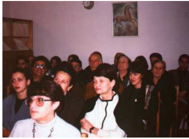
ალექსი რობაქიძის 90 წლისთავისადმი მიძღვნილი საიუბილეო სამეცნიერო სესია. ბათუმი, 1997 წელი

მეორე დღეს ინსტიტუტის დირექტორის კაბინეტის კარები მორიდებით შევაღე. პატივცემული ალექსი რობაქიძე მოვიკითხე. ოთახში სამი მა-