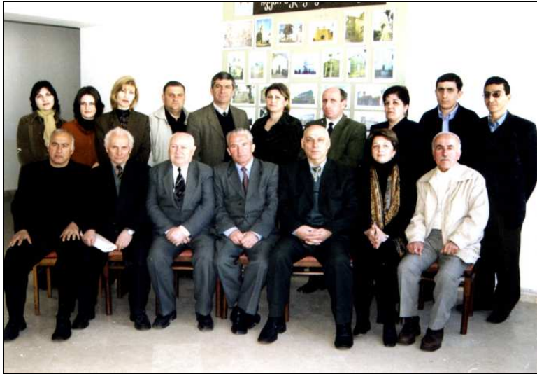
საქართველოს ისტორიის კათედრის პროფესორ-მასწავლებელთა ერთი ჯგუფი (2004 წ.)