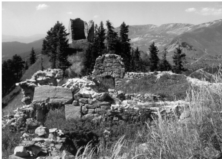
ხიხანის წმინდა გიორგის ეკლესიის ნანგრევები

შუახვევის რაიონის მარტო ერთ – მარეთის ხეობაში, სადაც ამჟამად მხოლოდ ერთი მოქმედი ეკლესიაა (გამონათღევის წმინდა გიორგის სახელობის), მოგზაურ-მკვლევართა ნაშრომებში 20-მდე სალოცავია დაფიქსირებული და რაც ყველაზე მეტად საგულისხმოა, აქ ამჟამად მოქმედ სასოფლო მუზეუმებში (ოლადაურის, კვიახიძეების) დაცულია არაერთი ექსპონატი, რომლებიც ჩვენი ქრისტიანული წარსულის შესახებ მიგვანიშნებენ.