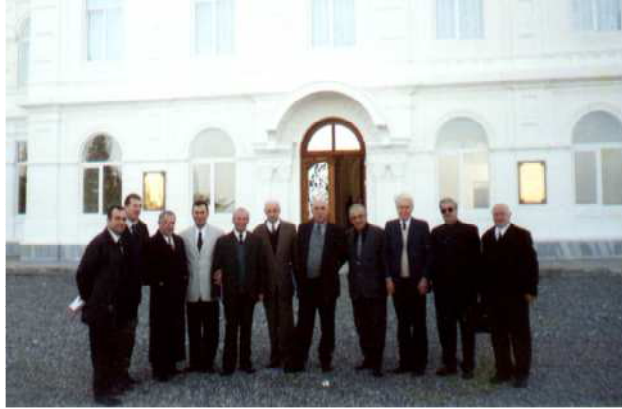
(კონფერენციის მონაწილეთა ერთი ჯგუფი)

ახალგაზრდობაში მშობლიური ისტორიის ცოდნის აუცილებლობის შეგნების ამადლების მიზნით, უმაღლესი სკოლების ჰუმანიტარულ სპეციალობებზე, სავალდებულოდ იქცეს მისაღები გამოცდების ჩატარება საქართველოს ისტორიაში;