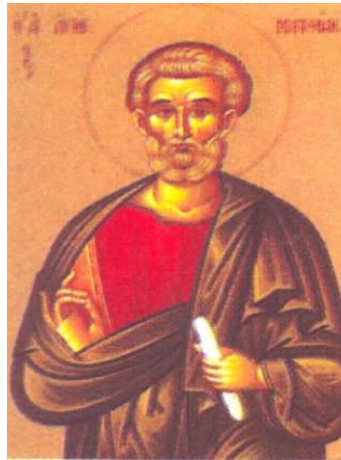
წმ. მათათა (მათე)

ასეთ პირობებში გამოჩნდნენ საქართველოს, კერძოდ, ისტორიული კოლხეთის ტერიტორიაზე ქრისტიანობის პირველი მქადაგებლები – ანდრია პირველწოდებული, სვიმონ კანანელი, მათათა და სხვ. მოციქულების შემოსვლას კოლხეთში ქართული წყაროებიდან ეხება “ქართლის ცხოვრების” ერთი ჩანართი, რომლის მიხედვით ანდრია პირველწოდებული სვიმონ კანანელთან ერთად ეწვია ჯერ ტრაპიზონის მხარეს, შემდეგ “ქვეყანასა ქართლისასა, რომელსაც დიდაჭარა ეწოდების”. “ქართლის ცხოვრებაში” ეს ამბავი ასეა აღწერილი: “დაიწყო ქადაგებად სახარებისა, რამეთუ კაცნი პირუტყუთა უუგნურეს იყვნეს და არა იცნობდეს შემოქმედსა ღმერთსა, ყოველსა საძაგელსა და არაწმინდასა წესსა აღასრულებდეს, რომელი სათქმელადაცა უჯერო