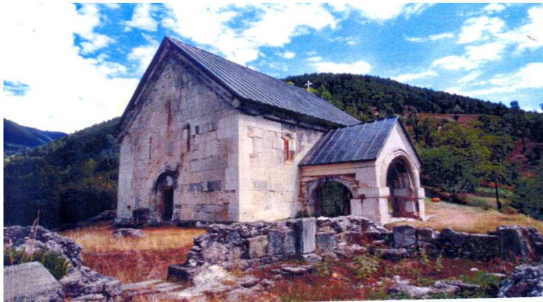
სხალთის ეკლესია (XIII ს.)

აჭარისწყლის ხეობა, ისტორიული ტრადიციის მიხედვით, ქრისტეს პირველმოციქულთა ხანაში ეზიარა ქრისტიანულ მოძღვრებას და წმ. ანდრია პირველწოდებულმა დიდაჭარაში აღაშენა პირველი ეკლესია „შუენიერი სახელსა ზედა ყოვლად-წმიდისა ღვთისმშობლისა (ქცა,1955:39), მაგრამ IX საუკუნეზე ადრინდელი საკულტო ნაგებობების ნაშთები აქ, ჯერჯერობით, არაა გამოვლენილი. მომდევნო ხანის ეკლესია-მონასტერთაგან მეტ-ნაკლები დაზიანებებით, მაგრამ სრული სახით, მხოლოდ სხალთის ეკლესიამ მოაღწია ჩვენამდე.