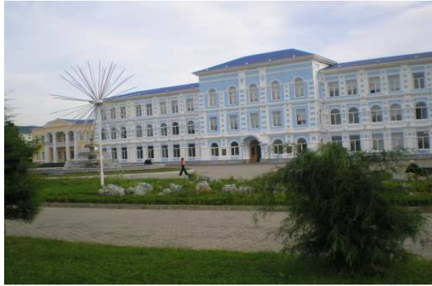
უნივერსიტეტის ხედი (ნინოშვილის ქუჩიდან)

ზღვისპირას თოლიასავეთ, თეთრო ტაძარო მუზის, ნიჭის და ცოდნის ნათებავ, ხსნად მოვლენილო ქვეყნის. ტბეთის და სხალთის ხატებავ, ამონათებავ რვალის, ფაზისის, პეტრას მემკვიდრევ, ჩვენო იმედო ხვალის. ჩვენი შვილების კურთხევა, ლოცვა ერის და ბერის, ცად აგამადლებს იმედად, ჩვენის აწმეოს და ხვალის.