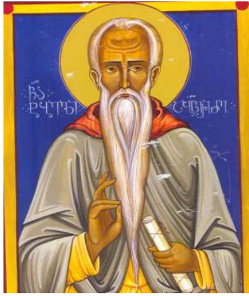
წმ. ტბელი აბუსერისძე

თუ გავითვალისწინებთ გამოთქმას – „ღმრთის სწორთა პატრონთა“, აქ უნდა იგულისხმებოდეს თამარი თავისი მეუღლით-დავით სოსლანით, რაც იმაზე მიანიშნებს, რომ ხიხანის მტრებისგან გამოსსნა 1188 წლის შემდეგ, თამარის დავით სოსლანზე დაქორწინების შემდეგ უნდა მომხდარიყო. ამასთან, გასათვალისწინებელია ისიც, რომ ერისთავთ-ერისთავი ივანე დაიღუპა „თურქთა ხელითა“. ამიტომ მკვლევარები ვარაუდობენ, რომ ასეთი პირობები 90-იან წლებში ბევრჯერ შეიქმნა, რადგან საქართველოს მრავალი დიდი თუ პატარა ომი ჰქონდა სელჩუკებთან ადარბადაგანში, შამქორში, კართან, აჭარაში და სხვაგან. თ. ჟორდანიას ფიქრობდა, რომ ერისთავთ-ერისთავი ივანე ბასიანის ბრძოლაში უნდა დაღუპულიყო. ამ აზრს იზიარებდა ლ. მუსხელიშვილიც, ოღონდ ბრძოლის თარიღში არ ეთანხმებოდა თ. ჟორდანიას. შემდეგ, აბუსერისძეთა შესახებ ტბელის თხზულებაში მოცემული მონაცემების ანალიზის საფუძველზე, იგი 1191 წელზე შენერდა. საქმე იმაშია, რომ სწორედ ამ წელს დასაველეთ და სამხრეთ საქართველოს ფეოდალური არისტოკრატის დიდმა ნაწილმა მოინდომა გიორგი რუსის ხელახლა