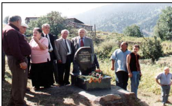
სელიმ ხიმშიაშვილის მემორიალი ხულოს რაიონის სოფელ ბაკოში (სერიყანა)

დაკვირვება, რომ 1770 წლის ცნობილ ასპინძის ბრძოლაში ახალციხის საფაშოს მხარეზე აჭარის სანჯაყი არ მონაწილეობდა. „როგორც ჩანს, - ასკენის მკვლევარი, აჭარამ ახალციხის ნომა ფაშას ერეკლეს წინააღმდეგ ბრძოლაში მონაწილეობაზე უარი უთხრა... რის გამოც 1774 წლის მაისში აფორიაქებულ აჭარაში თურქთა დამსჯელი კორპუსი შევიდა.“