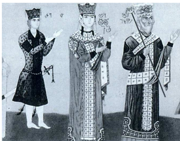
ლაშა-გიორგი, თამარი, გიორგი III (ბეთანიის ფრესკის ასლი)

როგან არაბულ-სპარსულ კულტურასაც გასცნობოდა და ამით თავისი მწერლობა და ხელოვნება კიდევ უფრო გაემდიდრებინა (14:370). ამ დროს შეიქმნა საქართველოში იყალთოსა და გელათის აკადემიები, კიდევ უფრო გააქტიურეს თავიანთი საქმიანობა საზღვარგარეთ არსებულმა კულტურულ-საგანმანათლებლო ცენტრებმა (ივერიის მონასტერი ათონის მთაზე; შავი მთა – სირიაში, ანტიოქიის მახლობლად; ჯვრის მონასტერი – პალესტინაში; პეტრიწონის მონასტერი – ბულგარეთში), ითარგმნა და ადგილზე შეიქმნა მსოფლიო დონის მხატვრული თუ ფილოსოფიური ხასიათის თხზულებები, სადაც ასახვა ჰპოვა იმდროინდელი საქართველოს საზოგადოების მიღწევებმა პოლიტიკურ თუ სულიერ სფეროში. ვფიქრობთ, ამ თვალსაზრისით მრავლისმთქმელი უნდა იყოს ქალის - თამარის გამეფებაც. აი, ასეთი ეპოქის შეიღია ლაშა-გიორგი. იგი თამარის მეფობის ბოლო წლებში, დავით სოსლანის გარდაცვალების შემდეგ, დედის თანამოსაყდრედაც ითვლებოდა.