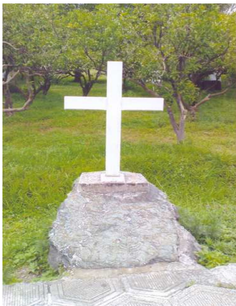
წმ. მატათას (მათეს) საფლავი გონიო-აფსაროსში

წერილობითი წყაროების მიხედვით, საქართველოში მისიონერული საქმიანობისათვის ჩამოსული ჩანან ქრისტეს იმ თორმეტ მოციქულთაგან სამი (წმ. ანდრია, სვიმონი და მატათა (მათე), თუმცა მოგვიანო პერიოდის წყაროები წმ. ბართოლომეს, თადეოსს და სხვებსაც ასახელებენ.