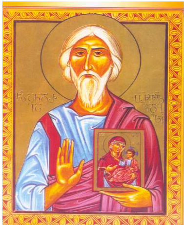
წმ. ანდრია პირველწოდებული

რეაზიელები შეადგენდნენ. მცირე აზია კი ამ დროს რომის იმპერიის ის რეგიონია, სადაც ჩაისახა და გავრცელდა ქრისტიანული იდეები. უნდა ვიგულისხმოთ, რომ ამ ტერიტორიებიდან წამოყვანილ ლეგიონერთა მნიშვნელოვანი ნაწილი უკვე ნაზიარები იყო ქრისტიანულ იდეებს.