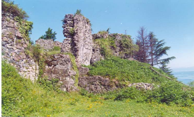
პეტრას საეპისკოპოსოს ნაშთი (VI ს.)

თარიღება და მას პეტრას საკათედრო ტაძრად მიიხსენებენ (ინაიშვილი, 1974:135-138; Леквинадзе, 1973:139; Мелитаური, 1971:17-18).