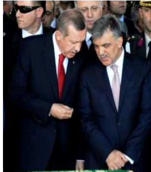
რ. ერდოლანი და ა. გული

ერდოლანის მთავრობის ერთ-ერთი ყველაზე გამორჩეული პროექტი იყო ე. წ. „ქურთული ინიციატივა“, რომელიც მიზნად ისახავდა ქურთული წარმოშობის მოქალაქეების წინაშე არსებული პრობლემების მოგვარებას. ამ მიზნით თურქეთის სახელმწიფო ტელევიზიაში 24 საათიანი მაუწყებლობა დაიწყო ქურთულენოვანმა არხმა, გაიხსნა ქურთული ენის შემსწავლელი კურსები და ფაკულტეტები უმაღლეს სასწავლებლებში; შემუშავდა და განხორციელდა სოციალური და ეკონომიკური ხასიათის პროექტები ქვეყნის სამხრეთ-აღმოსავლეთში მცხოვრებ მოქალაქეებისათვის.