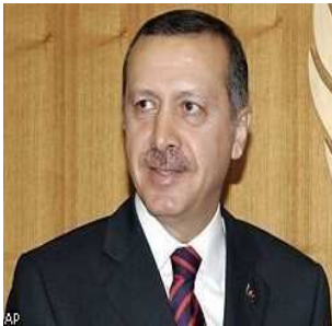
რეჯეფ თაიფ ერდოღანი

1999 წლის 2 მაისს პირველად შეიკრიბა თურქეთის ახლადარჩეული 21-ე მონვევის დიდი ეროვნული კრება, რომელიც ექსესებით დაიწყო. სხდომაზე ისლამური „სათნოების“ პარტიის დეპუტატის, მერვე ქავაქჩის პარლამენტში თავსაბურთით გამოჩენამ დიდი აჟიოტაჟი გამოიწვია.