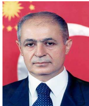
აჰმეთ ნეჯდეთ სეზერი

„მემარცხენე - დემოკრატიული“ პარტიის გამარჯვება მეტწილად გამოწვეული იყო, მათი მთავრობაში მოღვაწეობის პირველსავე თვეს, კენიაში თურქეთის ნომერ პირველ მტრად შერაცხული, „ქურთისტანის მუშათა“ პარტიის დამაარსებლის და ლიდერის აბდულაჰ ოჯალანის დაკავებით. ამ ფაქტმა საზოგადოების თვალში „მემარცხენე-დემოკრატიული“ პარტია და მისი ლიდერი ბ. ეჯე-