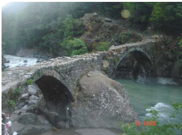
ჩხალისწყლის ზიდი სოფ. დუზქოიში, სკიბათის უბანში, ნიგალის ხეობა (თურქეთი)