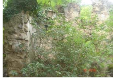
ნაეკლესიარი სოფელ სვეტში, ნიგალის უბანში

შენახულია ერთი პატარა გუმბათიანი თლილის ქვით ნაშენი ეკლესია. ეს პატარა ეკლესია სოფ. მამაწმინდის წინ დგას. ერთ მშვენიერ ალაგას, სადაც საყანური ადგილებია. ეკლესიას გარშემო მეტად ბებერი ვაზისა და კაკლის ხეები ახვევია და მთელს ამ ხეობას ობლად გადმომზერია. გუმბათში