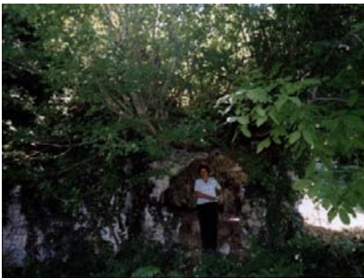
მამაწმინდის ეკლესიის ფრესკები

შენახულია ერთი პატარა გუმბათიანი თლილის ქვით ნაშენი ეკლესია. ეს პატარა ეკლესია სოფ. მამაწმინდის წინ დგას. ერთ მშვენიერ ალაგას, სადაც საყანური ადგილებია. ეკლესიას გარშემო მეტად ბებერი ვაზისა და კაკლის ხეები ახვევია და მთელს ამ ხეობას ობლად გადმომზერია. გუმბათში