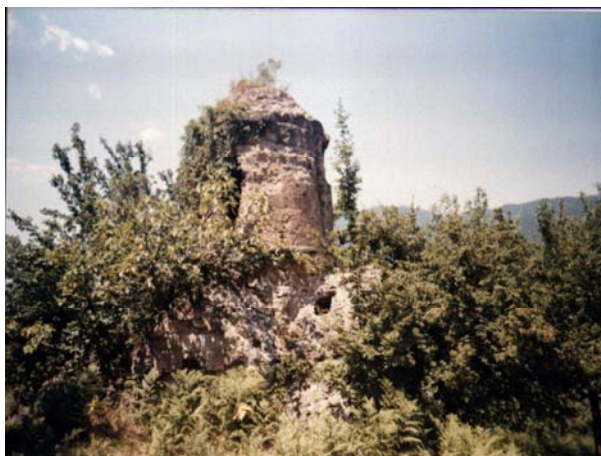
მამაწმინდის ეკლესია, კლარჯეთი