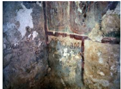
მამაწმინდის ეკლესიის შე სასკვლეო

მხატვრობა შეუშლელია, ასევე ძირის კედლებზე, ერთ ალაგას დახატულია რამდენიმე კაცი ბერძნულის ტანთსაცმლით, ზოგი-