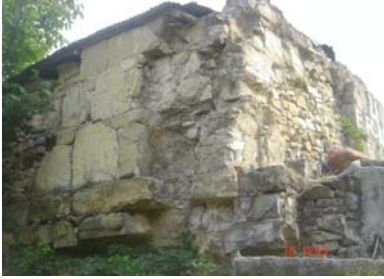
სვეტის ეკლესიის ნაშთი, გადაკეთებული პურსაცხოვად ქილისაყაფის უბანში

XIX-XX სს. მიჯნაზე ზ. ჭიჭინაძე აღწერს ამ ძეგლს: „აქეთ ყოველ სოფელში ნახავს კაცი ეკლესიის ნანგრევს. სოფ. პეტრულში – კი მთლად